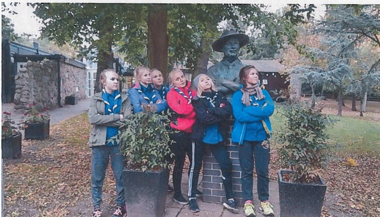
Kuva 2. Katse kohti tulevaisuutta Baden-Powellin seurassa Gilwell Parkissa.