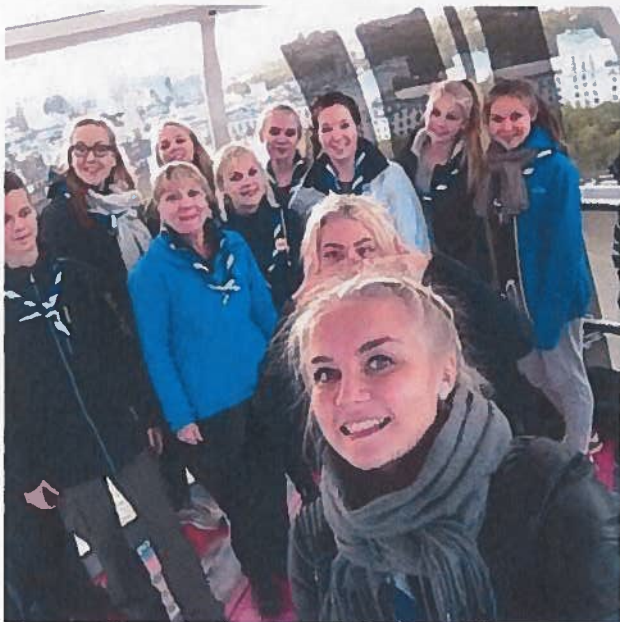
Kuva 6. Piketit London Eyessa!