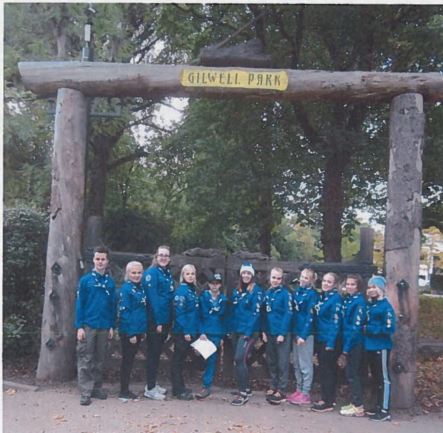
Ryhmäkuva Parkin pääportilla.